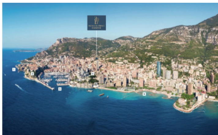
1 Port and business district of Forville | 2 The Rock and the Prince's Palace | 3 Port Hercules | 4 The Place du Casino and the Opéra Garnier | 5 Lanette Beach